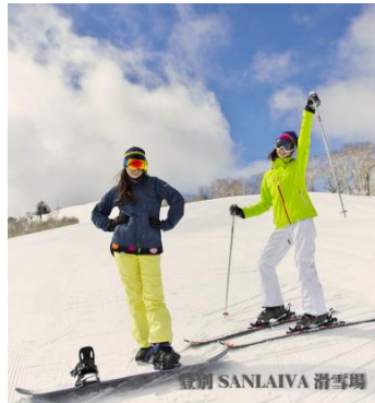
登別 SANLAIVA 滑雪場

親自駕駛雪上電單車，茫茫飄雪中駕駛雪上電單車奔馳於大雪原，眼前盡是彎曲跑道，車行走於彎曲迂迴、崎嶇起伏的山巒間，享受冷風拍面及刺激的速度感，欣賞不一樣的雪景及享受駕駛樂趣。