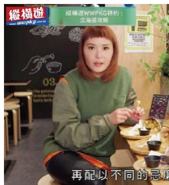
再配以不同的忌廉