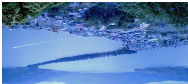
1) 北端：傘松公園展望台 - 「昇龍觀」