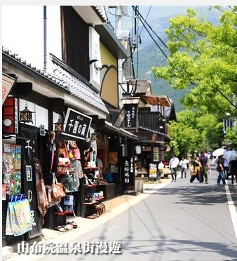
由布院溫泉街漫遊