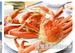
活蟹活魚海鮮市場