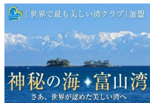
最美麗海灣【富山灣】

富山灣經聯合國教科文組織下的「世界最美麗海灣組織」正式審定通過登錄為「世界最美麗海灣」之一(全球有38個,富山灣為日本第二個)。特地安排前往海王丸公園,眺望高46米的巨型帆船海王丸號以及這個最美麗海灣的景色,如天氣晴朗,更能欣賞立山黑部連峰的絕景!