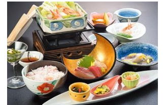
海鮮御膳 ×圖片只供參考

由於富山縣臨近富山灣，富山縣地域的海鮮均新鮮味美，種類繁多，再加上使用昆布及富山縣產的越光大米做出的飯特別香糯，粒粒分明。加上鮮美海鮮，特別滋味！