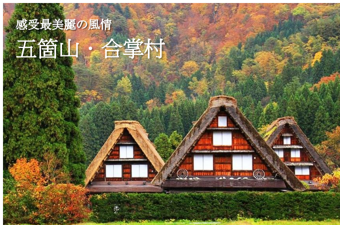
感受最美麗的風情 五箇山·合掌村