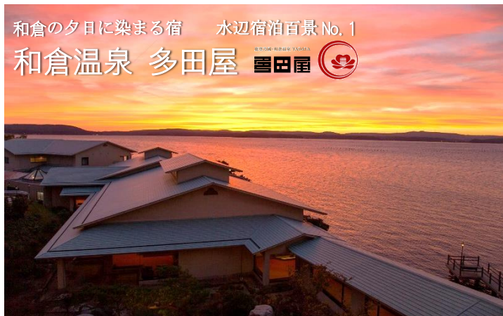
和倉の夕日に染まる宿 水辺宿泊百景 No.1 和倉溫泉 多田屋