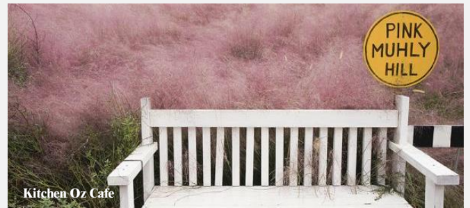
Kitchen Oz Cafe

韓國超人氣的綠茶醬便是出自這個品牌，博物館展示各種綠茶產品及護膚品，又是購物的好時機！另外，亦可在咖啡室內品嚐美味的綠茶甜品！館外一大片遼闊的綠茶田，是打卡拍照的好地方。