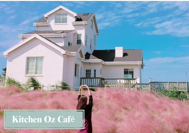
Kitchen Oz Café