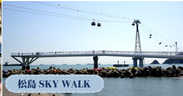
松島 SKY WALK