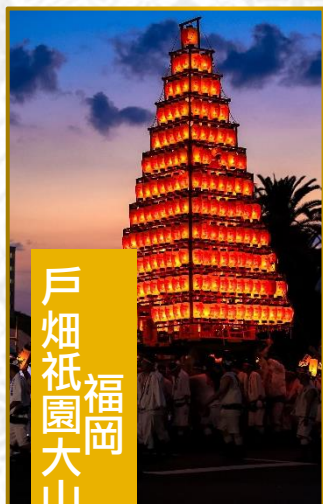
戶畑祇園 福岡 大山祭

具有 200 多年的歷史，燈籠山笠高約 10 米、重量 2.5 噸，大約 60 個人隨著錚聲和大鼓聲的伴奏，邊喊著獨特的號子聲，邊勇猛地扛著燈籠山笠前行。