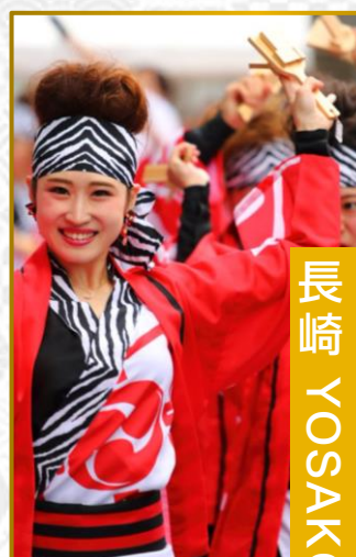
長崎 YOSAKOI 祭

日田祇園祭已有 300 年的歷史，也是日本指定重要無形民俗文化財，屆時會有多輛高約 3 層樓的大型華麗花轎(山車)參加祭典。