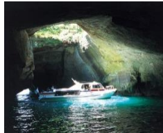
西伊豆堂ヶ島洞窟觀光遊覽船

搭乘遊覽船穿梭奇形怪狀的岩石間，可欣賞隱藏其中的海蝕岩洞、變化多端的海岸奇景，以及天窗洞的天然造型。堂ヶ島洞窟遊覽船沿著西伊豆海岸線途經數座小島，可將西伊豆崎嶇優美的海岸景觀盡收眼底，彷彿經歷一次小小的海上冒險。