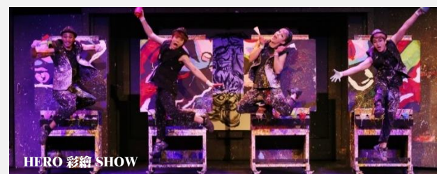
HERO 彩繪 SHOW

3D 美術館分為畫世界、奇幻旅程、別出花樣、水上樂園及特麗愛經典館藏。各種稀奇古怪的 3D 立體畫，讓您發揮創意擺出各種姿勢融入畫中，成為旅程中趣味回憶！冰雪館中除了有雪屋體驗、冰雕城探險等活動，還可以坐在冰雕雪橇上做魯道夫。最後，還有長達 10 米的冰製滑梯，感受冰涼刺骨的樂趣。