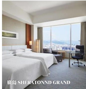
廣島 SHERATONND GRAND