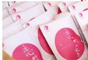
- 戀來井戶 -

可以在廣場裡的小箱購買空樽(約200円),裝下旁邊一直湧出的源泉100%的美肌溫泉水,帶回家作爽膚水使用。*保質期為5天