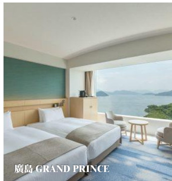
廣島 GRAND PRINCE

https://www.princehotels.co.jp/hiroshima/