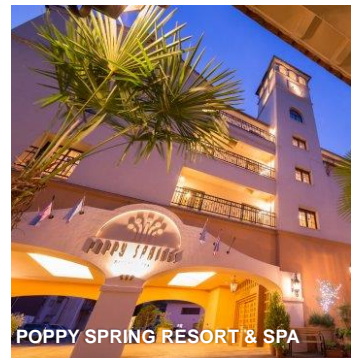
POPPY SPRING RESORT & SPA