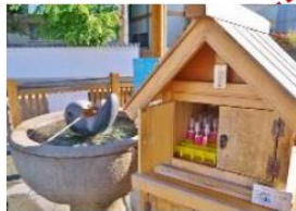
- 湯藥師廣場 -

可以在廣場裡的小箱購買空樽(約200円),裝下旁邊一直湧出的源泉100%的美肌溫泉水,帶回家作爽膚水使用。*保質期為5天