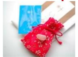
- 玉作湯神社 -

內有許願石,只要手摸它許願,有機會夢想成真。若把神社的願望成真石(約600円)與許願石相碰後許願,更將許願石的力量帶回家。