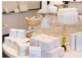
- 姬 LABO -