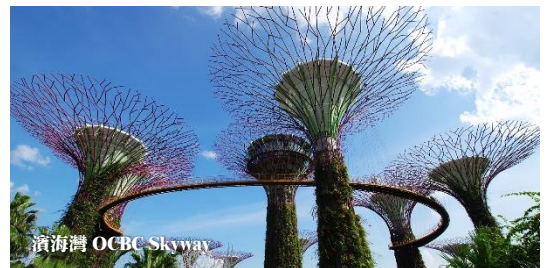
濱海灣 OCBC Skyway

濱海灣花園分別為中央花園、東花園和南花園構成，總面積超過 100 萬平方米。當中以人造的大樹造型建築 SuperTree 最為壯觀，貼心安排登上 SuperTree22 公尺高的 OCBC SkyWay 空中走廊，眺望整個濱海灣花園和新加坡市景，可望到金沙娛樂城、Singapore Flyer 等著名景點。