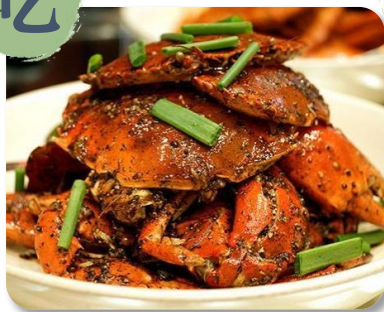
阿一海鮮 招牌黑胡椒螃蟹