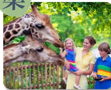
超過 300 種動物 新加坡動物園