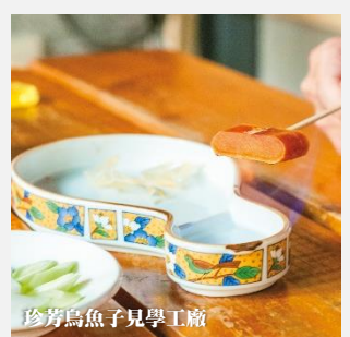
珍芳烏魚子見學工廠