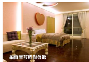
福爾摩莎時尚會館