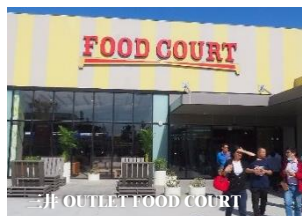
三井 OUTLET FOOD COURT