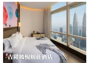
吉隆坡悅榕莊酒店