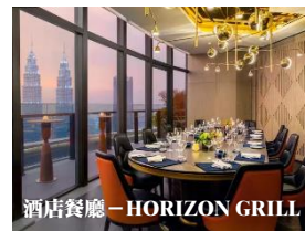
酒店餐廳 - HORIZON GRILL