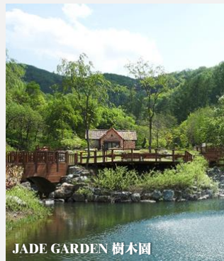
JADE GARDEN 樹木園