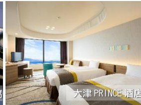
大津 PRINCE 酒店