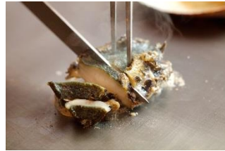
伊勢灣鐵板燒料理 · 味覺盛宴

可到《G7 峰會》各國首腦拍攝合照的頂樓庭園，將英虞灣的落日餘暉盡收眼底，也可模仿各國首腦合照的姿態拍照留念！