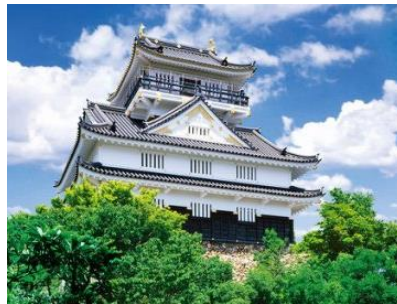
織田信長天下布武的起點【岐阜城】

包乘坐金華山纜車來回(約乘坐 3 分鐘)，纜車特地使用大玻璃窗，讓您可以 360 度無死角欣賞沿途的登山美景，俯瞰山下岐阜公園與山道，放眼遠眺平原中的山脈，像一條線般穿過城市的長良河、一直綿延至地平線的濃尾平原及在平原邊鋪開的街道等等，風光遼闊而壯觀。