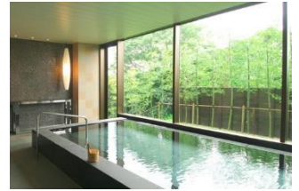
放鬆享受寬敞大浴池

主廚精心製作的鐵板燒料理，以伊勢灣當季的新鮮食材放到鐵板上精心為您巧妙烹調，讓您得到視覺嗅覺味覺的最佳享受。