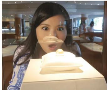
如風都讚嘆的國際品牌「MIKIMOTO」

御木本真珠島是在世界上首度試驗成功珍珠養殖方法的島嶼，御木本幸吉的品牌「MIKIMOTO」更是英國王室、日本皇妃等貴族名媛的愛用飾品。真珠島上有陳列展示以珍珠作成的藝術珍品及可以觀賞珍珠的養殖過程的「珍珠博物館」、介紹御木本幸吉的生涯及功勞的「御木本幸吉紀念館」、擁有販賣珍珠等的商店和餐廳的「珍珠廣場」等。更有機會欣賞海女採貝殼的表演(約 10 分鐘)，海女穿著稱為「磯著」的全白潛水服，單憑著屏著呼吸，潛水到海底採珍珠貝殼，難度十分高超。備註①