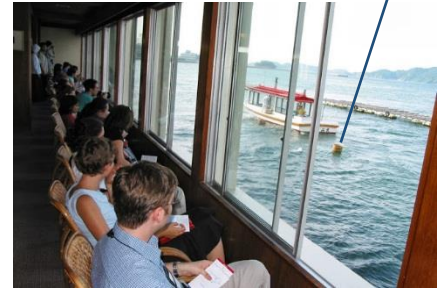
如風試玩過的海女表演