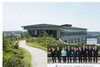
親臨 G7 峰會元首合照的庭園

客房採用摩登的西式設計，面積約 1000 呎，給您足夠的空間和私人時光徹底放鬆及休憩，窗外的露台可欣賞英虞灣的美景。