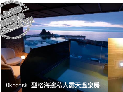
Okhotsk 型格海邊私人露天溫泉房