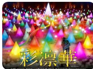
十勝川白鳥祭「彩凜華」

以人、藝術與自然相結合，展現魅力知床。會場設於知床國營野營場，需自行購票入場(約¥500)，有 ICEBAR、ART DOME、篝火空間等設施供玩樂。