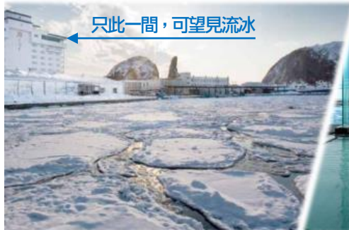
只此一閣，可望見流冰