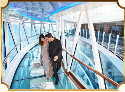
海上天空步道 THE SEA WALK

盛世公主號專屬的海上天空步道為您提供更絕妙的體驗，在長 8.5 米、距離海平面 39 米的透明玻璃走道上 360 度飽覽全海景，彷彿在浩翰大海上漂浮般，在欣賞美景之餘，也充分洗滌身心。