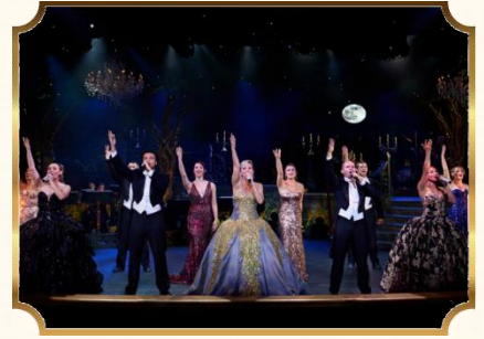
全新海上歌舞表演 PRINCESS THEATER

盛世公主號遊輪的「星空露天電影院」有著亞洲最大的海上 LED 螢幕與杜比環繞音響系統，提供高品質照明與音效，在滿天星斗的夜空下觀賞電影，讓您體驗獨特的戶外電影。