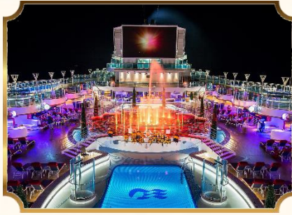
星空電影院 MOVIES UNDER THE STARS®

盛世公主號專屬的海上天空步道為您提供更絕妙的體驗，在長 8.5 米、距離海平面 39 米的透明玻璃走道上 360 度飽覽全海景，彷彿在浩翰大海上漂浮般，在欣賞美景之餘，也充分洗滌身心。