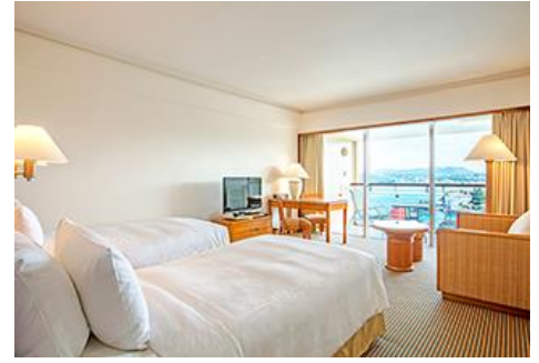
*1-4 名可同時入住/約 36m 2

酒店距離真榮田岬 (Maeda Cape) 2km, 距離月亮海灘 (Moon Beach) 2.2km。設有室外游泳池和室內游泳池。